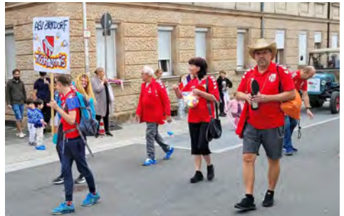
Bilder: Die Fußballer nach dem 3:1 Sieg gegen Tennenlohe beim Kärwazug, sowie der Fußball- und Tischtennisjugend beim Kärwazug in Zirndorf.